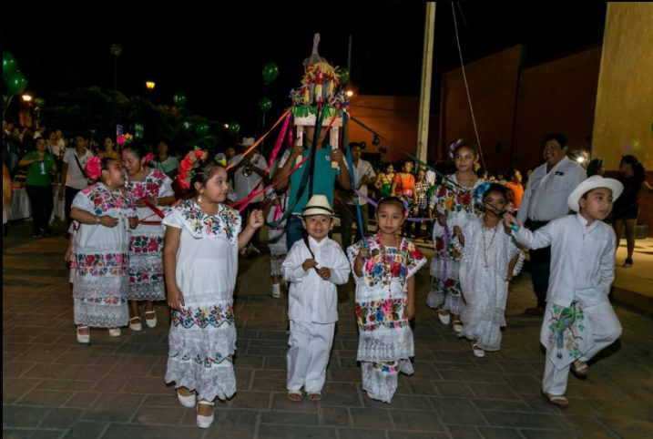
“Baile de la Cabeza De Cochino”